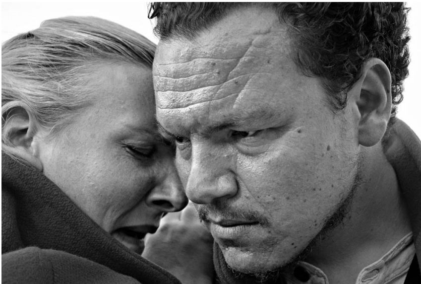
EDIPO RE - attori in scena (allestimento 2011)