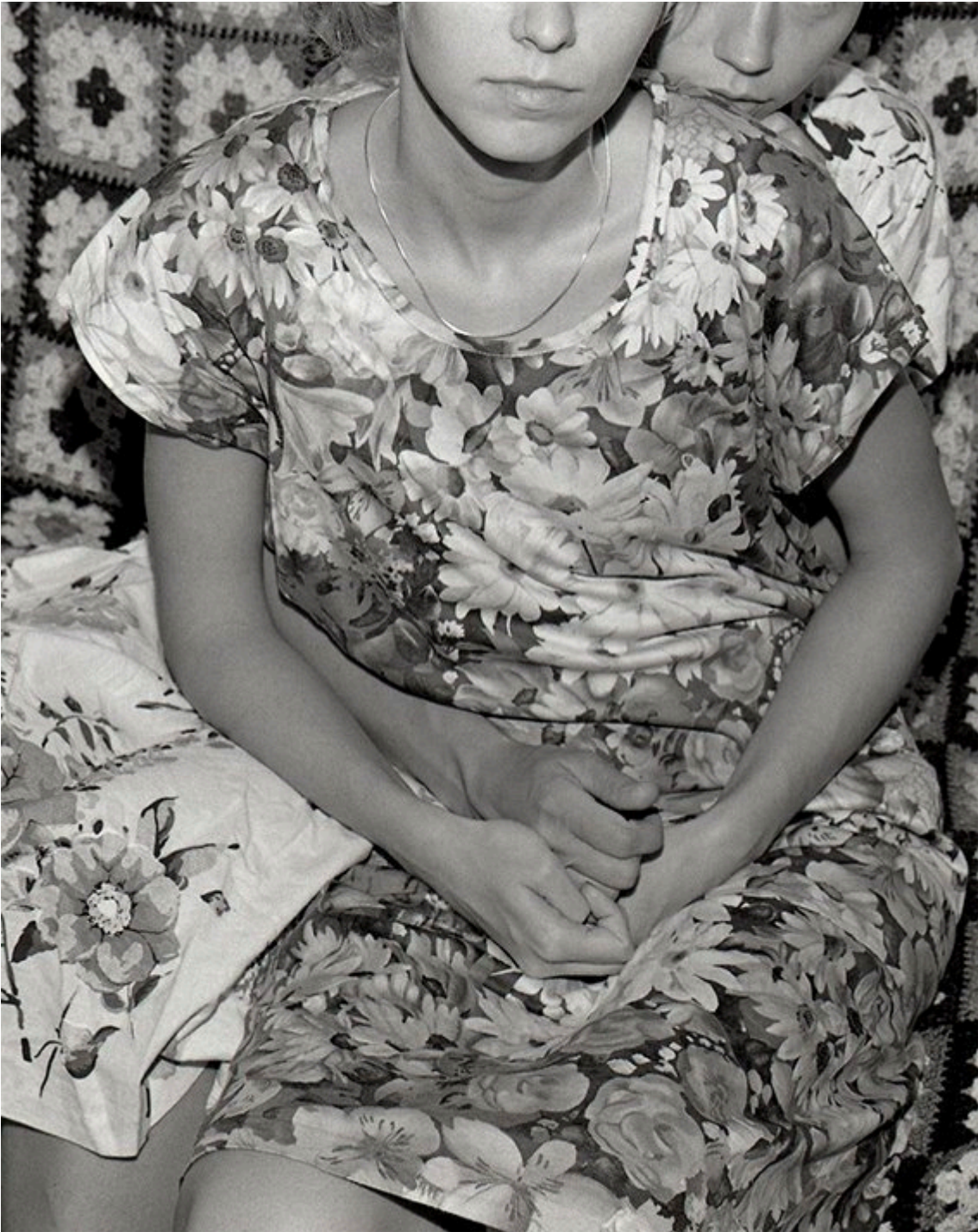
Ashes, MATERIA PRIMA FESTIVAL 2023