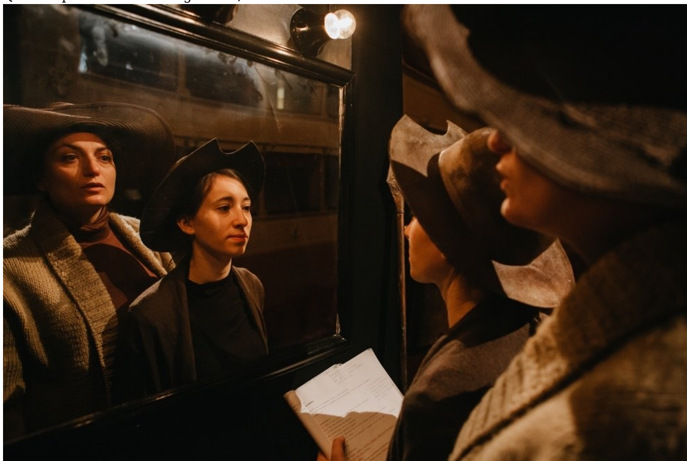
In Arte Son Chisciottò, MATERIA PRIMA FESTIVAL 2023