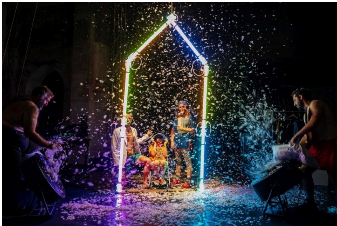
Pietre Nere, MATERIA PRIMA FESTIVAL 2023