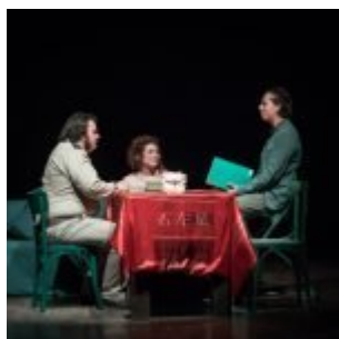
Questa splendida non belligeranza, MATERIA PRIMA FESTIVAL 2023