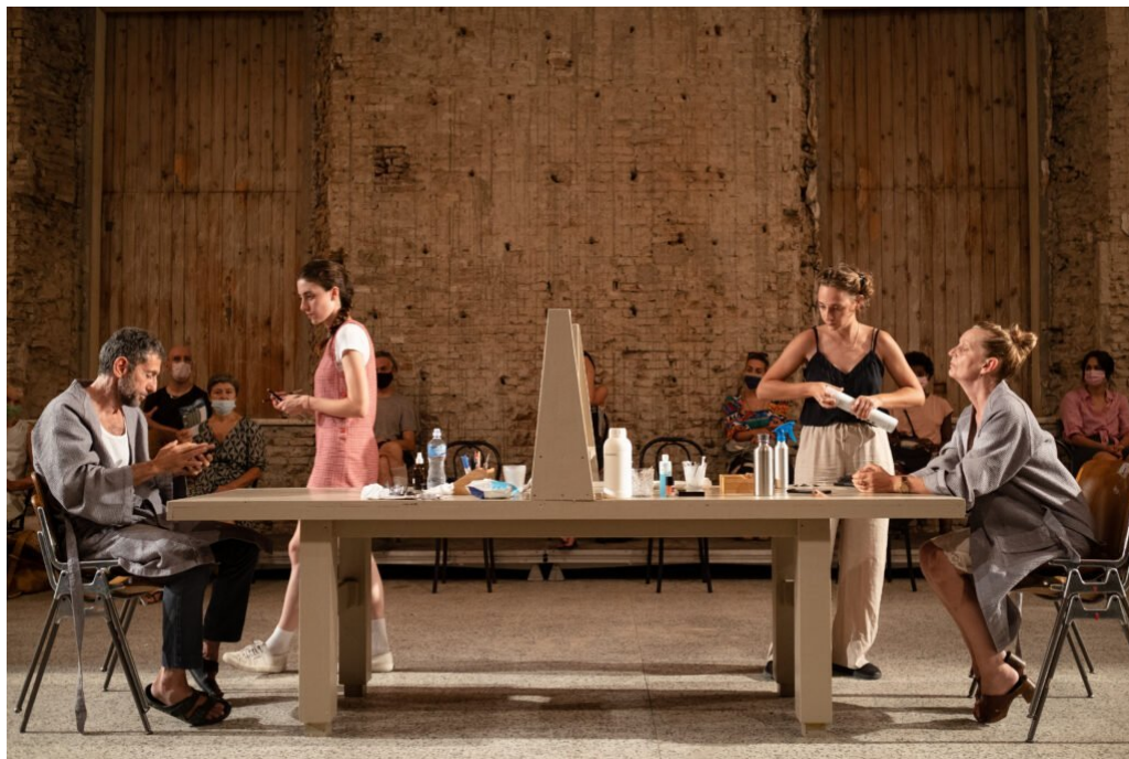
Sovrimpressioni, MATERIA PRIMA FESTIVAL 2023