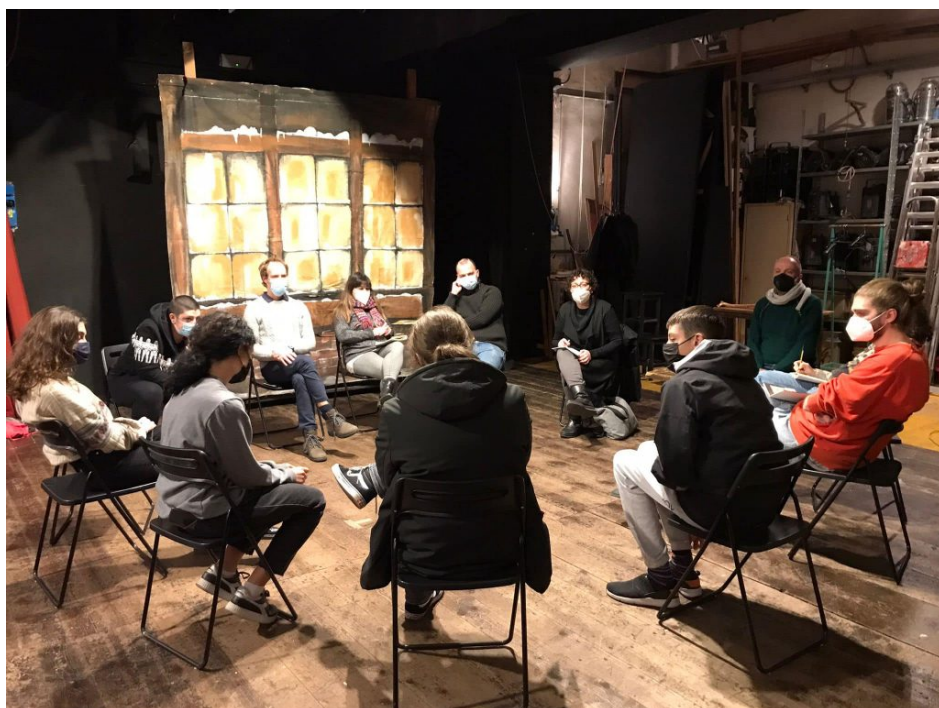
un momento di formazione IL RESPIRO DEL PUBBLICO 2021

La prima edizione della Scuola di Critica di Cantiere Obraz nasce nel 2021 , dopo la pandemia, che ha fermato il comparto della cultura, non solo per i professionisti del settore, ma anche per il pubblico, spesso dimenticato come elemento indispensabile per l'animazione culturale.